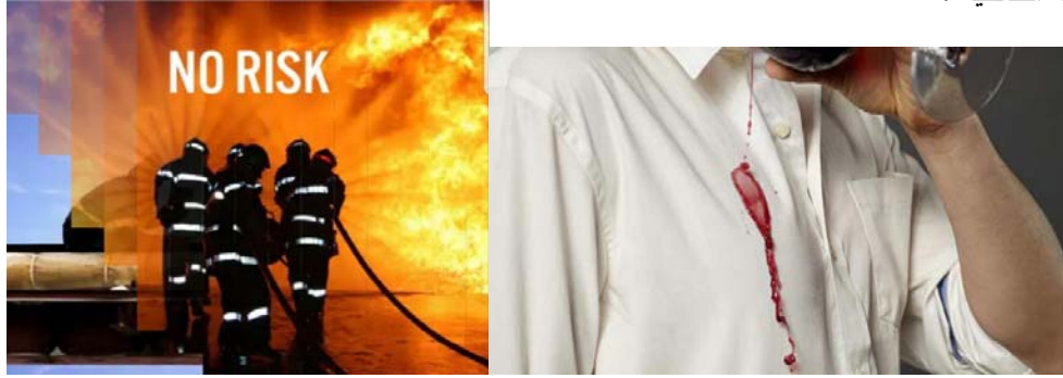
شكل رقم (6) يبين الاقمشة الذكية وتطبيقات تكنولوجيا النانو pinterest.com

والميكروبات، خصوصا في المجال الصحي، كذلك الملابس التقنية الذكية التي تخص الرياضيين لمتابعة الاداء الرياضي ومتابعة الحالة الصحية .