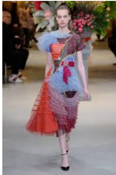
شكل (3) تصميم يبين الفكر الخيالي الإبداعي - دار ازياء فيكتور أند رولف

مجموعة ازياء بعنوان ( شارع الاحلام المحطمة ) من دار ازياء فيكتور اند رولف V&R الهولندية، التي عرضت في