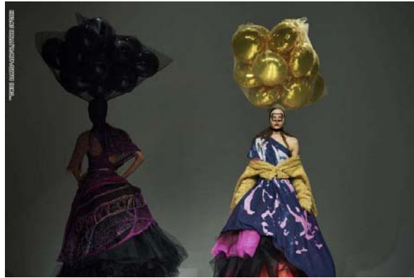
شكل(4) من مجموعة ازياء المصمم ماتى بوفان Arabic.cnn.com

وقد تميز هذا الزّي الملون بعدة قصات للفستان الطويل بشكل صاخب، وكان للغرابة والابتكار دور من خلال العدد الكبير لأقمشة الصوف الملونة والمطبوعة بتصاميم بسيطة، مساحات من خطوط ومنحنيات لونية، ويحيط الفستان جسم العارضة من الأعلى للأسفل مع ترك جزء من الكتف الأيسر مكشوفاً، ويأتي الجزء الأسفل محدد من الخصر وينزل بشكل منتفخ مثل الجرس، نتيجة وجود العدد الكبير من الأقمشة، كذلك بالنسبة للترزين فقد اضاف المصمم لمسات جميلة تعبر عنها بكيس من البالونات المشدود على الرأس في تناسق مع لون الفستان والقصات والأقمشة المتنوعة فيه.