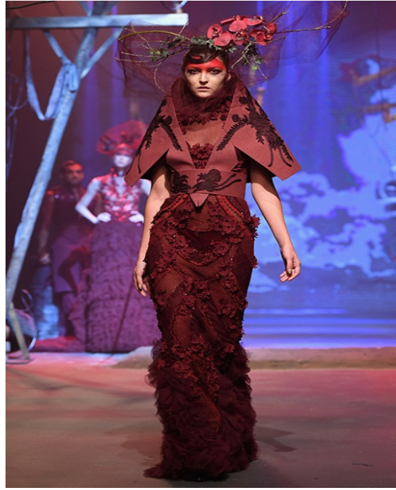
شكل (1) تصميم مستوحى من الخيال للمصمم فورن ون، www.akadnews.org

وقد كانت الفكرة التصميمية للمصمم، فورن ون، في مجموعته للأزياء عام 2017 والتي كانت في الامارات العربية المتحدة في معرض دبي العالمي للأزياء، Fashion World Dubai المستمد من قصة واقعية تختلط بالخيال، حيث اتسم التصميم المكون من قطعتين ( جاكيت قصير و فستان طويل) بالفراغة والخروج عن المألوف، والأناقة بنفس الوقت والحرفية العالية في استخدام التنوع في الخامة والتقنية المتطورة، وكان للخيال دورا في تنفيذ الزي ودلالاته، اذ تميزت فكرة عرض الزي بإبداع خيالي يكسر التقاليد المألوفة، حيث استوحى المصمم مصدر الهامه لرموزه ودلالاته، من احداث الفيلم التاريخي الصيني- الأمريكي Flowers of War حيث المغامرة والدراما، التي تمثلت بالعالم الخيالي، ووظيفها وفق رؤيته الخاصة بشكل ينم على معرفة بقواعد التصميم ومدخلاته التقنية، مما اكسب العمل القدرة على تأويل المفردة في خضم الكم الهائل من الاشكال في نظام متوازن من الكتل البنائية افصح عن حقائق الفكرة التصميمية للمصمم بمنعطفات اسلوبية حديثة جدا، ترجع في اصلها الى تصميم القماش اولاً والزي ثانياً كثنائي مكتمل، فقد استخدم قماش الحرير باللون الأحمر الغامق في الجزء العلوي المتمثل بقصة كبيرة لشكل الياقة العريضة والمتداخلة مع الجزء السفلي حيث قماش الدانتيل، مزينة بالزخارف النباتية الطبيعية ومنفذة بتقنية التطريز الآلي بالخياط اللامعة وبمهارة عالية، مرافقة لها المكملات الزينية لقبعة الرأس التي صنعت من قماش التول وزينت بالأزهار الصناعية من نفس نوعية الخامة للستان، لتمتج الوظيفة والجمال كلها في صورة زي نسائي راقى، لم تقل من شأنه، الفكرة الخيالية في التصميم.