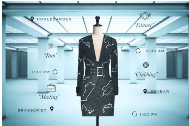
شكل (5) يبين فستان المستقبل المدمج بشيفرات الكترونية alarab.co.uk

يرتبط فن تصميم الاقمشة والازياء، مثل باقي الفنون، ارتباطا وثيقا بالتطور والتقدم التكنولوجي (التطبيقات العملية والعلمية)، اذ منح المصمم قدرة على التأثير والنمو والوصول بالخيال الى مستويات لم تكن قابلة للتصور، وازادت تقنيات التصنيع الجديدة التي نمت بعل تطور العلوم وتطبيقاتها، امكانيات كبيرة للعملية الانتاجية والتصميمية على كل المستويات، الشكل، الوظيفة والخامة... الخ، مما اتاح الحرية والخيال الواسع للمصمم تغيير شكل الهياكل وطريقة الأداء التي جعلت بالإمكان تحقيق خيال الماضي وتحويله الى واقع ملموس نحيا به في الحاضر، وتتفاعل مع نتائج تتميز بالإبداع الشكلي والوظيفي، كما في صناعة الاقمشة الذكية والالكترونية التي تتفاعل مع المستهلك وتتغير طبيعتها ومواصفاتها، وهذا التطور في الشكل والوظيفة والمواد هو نتيجة التأثير بفاعلية التطور التكنولوجي، ومدى ما وفرتة من قوة اخرى تضاف الى القوى الإبداعية للمصمم، وتتيح له حرية اختيار الطرائق المتنوعة في الإخراج النهائي وتشكيل بعضها البعض وتجاوز المحددات والشروط الوظيفية، دون الغاءها، للتعبير عن قوة التطور كعامل فاعل في العملية التصميمية، فتنوعت الوظيفة من حيث الابتكار والتنوع في وظيفة القماش الواحد، فوجد خامات اقمشة لم تكن موجودة لولا الخيال الابداعي الذي يسعى الى توفير الراحة والرفاهية والتميز، ومثال الازياء المدمجة مع الإلكترونيات وكما في الشكل رقم (5) الذي يبين "فستان المعلومات" او فستان المستقبل الذي يتكون من شيفرات للبرمجة تدخل في نسيجه، وقد تعاونت شركة غوغل مع شركة دار ازياء ( ايفرال - H&M) في صنعه.